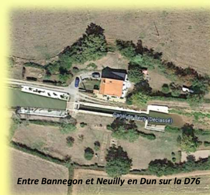
Entre Bannegon et Neuilly en Dun sur la D76

En cas d'orage, pluie, grêle, grand froid, le pic-nic sera annulé.